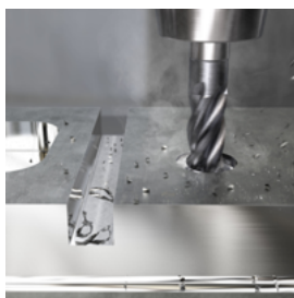
超静音エンドミル CoroMill® Dura