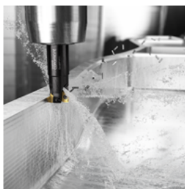
進化した高精度肩削り フライスカッター CoroMill® MS20