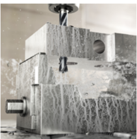
ステンレス鋼用の 最適化ドリル CoroDrill® 860-MM