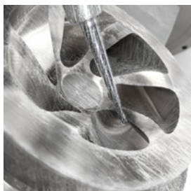
耐熱合金・チタン 合金の卓越した倣い加工 CoroMill® Pluraボール エンドミル