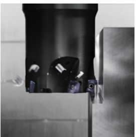
鋼フライス加工用 チップ材種 GC1230