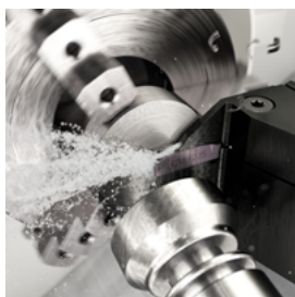
多用途な突切り・ 溝入れ工具 CoroCut® 2