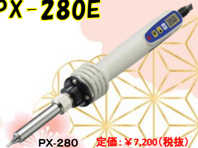
PX-280 定価:¥7,200(税抜) PX-280E 定価:¥7,900(税抜) (3芯プラグ)

従来の温度調整可能はんだこてはダイヤル式がほとんどでしたが、goot(グット)のはんだこてにボタン式ができました。暗証番号方式でキーロックが可能で、不要な温度変更を簡単に防げます。また、スリープ機能でこて先の酸化を守ったり、使用停止後一定時間が経過すると自動的に電源をOFFにするなど、サポート機能もしっかりついています。200℃~500℃まで対応で、立ち上がりから約30秒で350℃まで加熱します。ミドルクラスのステーションはんだこてに匹敵する加熱性能で、連続作業にも対応する一台です。