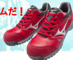
レッド×シルバー×ブラック

足にあたるペロ(甲部分)、インソール、履き口まわりがソフトな履きごちなうえに、履き口(内側)に人工皮革で補強している為、メッシュに比べ耐久性がアップしました。反射材を搭載し、夜間等の暗い場所の視認も安心。滑りにくく、耐滑、耐油性はもちろん、屈曲性、水はけも抜群です。作業靴として是非現場で使用してみてください！