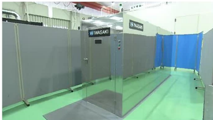
荷物・ショッピングカート用装置(外観)