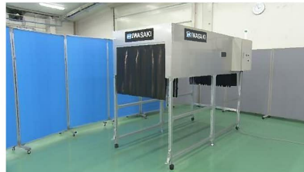
荷物コンベア用装置(外観)