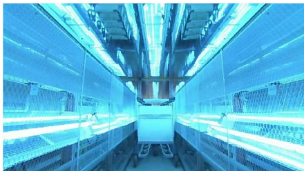
荷物・ショッピングカート用装置(内部)