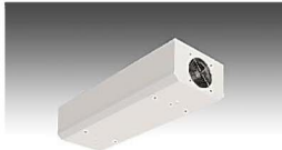
エアリア シーリング