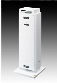
エアリア コンパクト