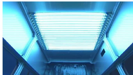
荷物コンベア用装置(内部)